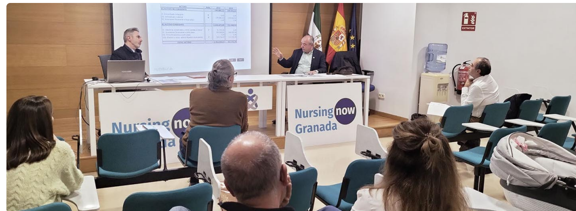
Parte de la Junta del Colegio, durante la Asamblea general