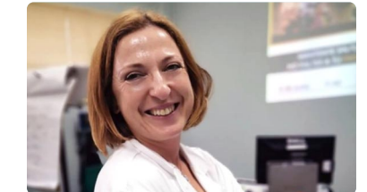
Las principales dificultades de un enfermero investigador