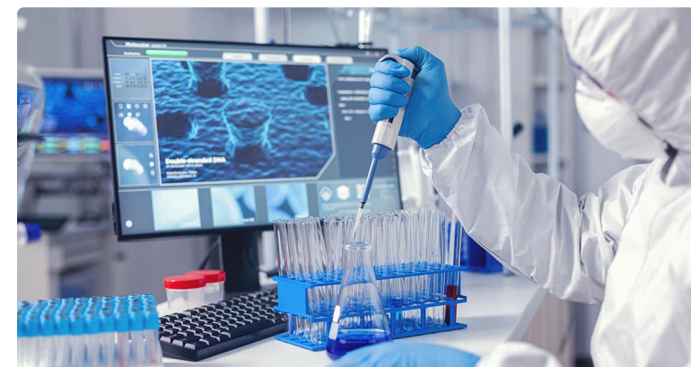
Profesional enfermero desarrollando actividad investigadora en centro

Facilitar la labor investigadora, fomentar la innovación y garantizar el acceso a fuentes de información científicas, compartir recursos, programas de formación y proyectos de investigación y desarrollo son algunas de las prioridades para el CAE.