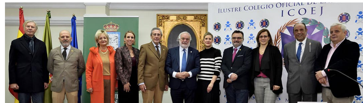
Foto de grupo de los asistentes a la firma del convenio

Los responsables institucionales han estado acompañados por miembros de sus Juntas de Gobierno. ■