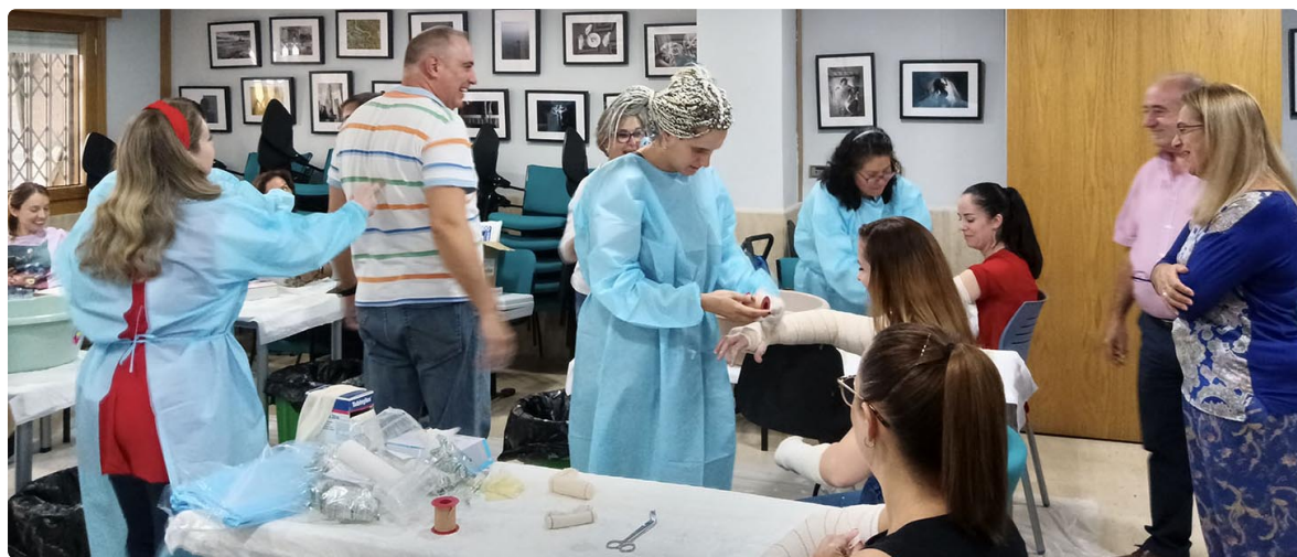
Alumnado participa en uno de los cursos de formación organizados por el Colegio de Granada

"Nos encargamos de facilitar a los colegiados un abanico de opciones formativas que incluyen cursos especializados y otros de reciclaje", ha añadido Escobar. ■