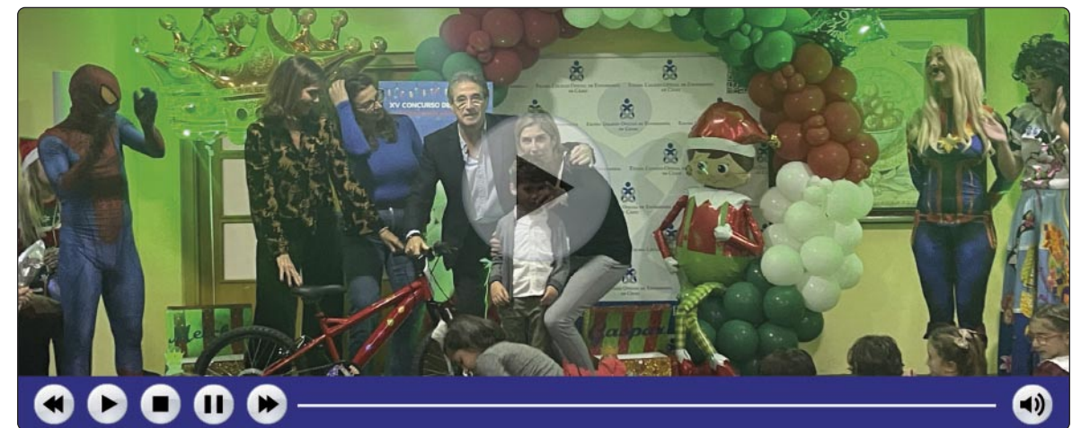
Si no puede ver el vídeo correctamente pinche aquí

Además de los galardonados, todos los pequeños recibieron un obsequio sólo por participar en el concurso. Los dibujos premiados ilustraron la postal que el Colegio de Enfermería de Cádiz remitió a sus colegiados y empresas colaboradoras para felicitar la Navidad. ■