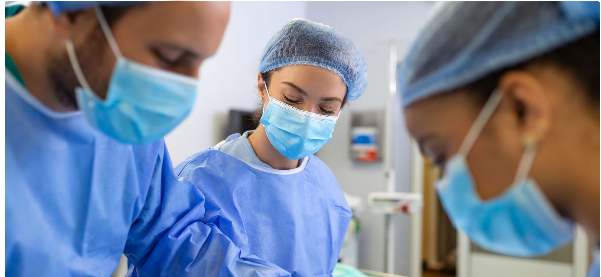
Enfermeras de Práctica Avanzada realizando labores de atención a persona con ostomía

cada dentro del marco de desarrollo establecido en el Real Decreto (RD) 954/2015, de 23 de octubre, por el que se regula la indicación, uso y autorización de dispensación de medicamentos y productos sanitarios de uso humano por parte de