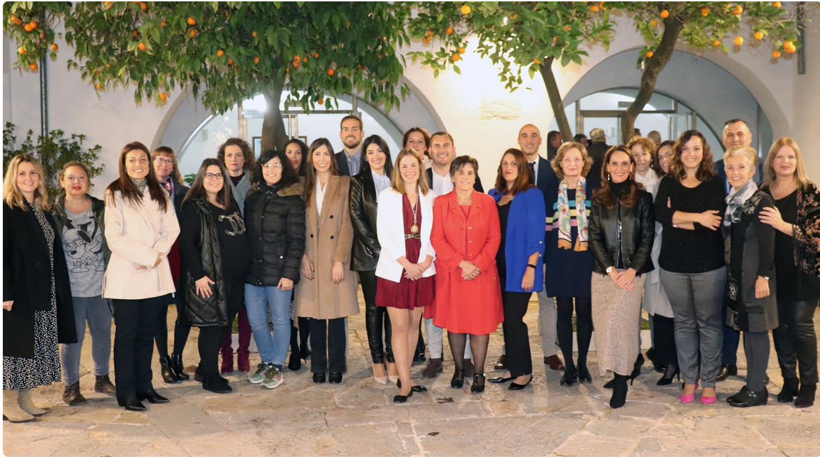
La nueva Ejecutiva y los nuevos vocales de la Comisión Plenaria tras la toma de posesión