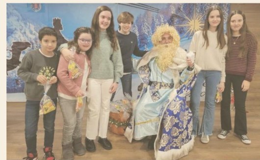
Los niños posan con uno de los Reyes Magos.

Sus Majestades de Oriente reciben a unos 600 menores, hijos de los miembros del Colegio, en la residencia de mayores